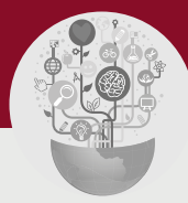
Kompetens & Omvärld

Med 30 års erfarenhet av lärande står Pysslingen Skolor för både tradition och nytänkande.