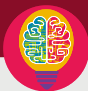
Utveckling & Lärande